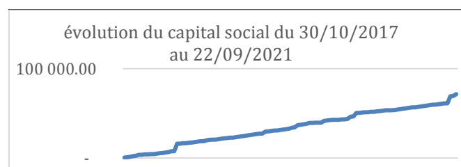
Tableau de l'évolution du capital social en EUROS

La souscription de capital social auprès des habitants du territoire a été forte au démarrage, et se poursuit régulièrement, même si nous souhaiterions parfois aller plus vite.